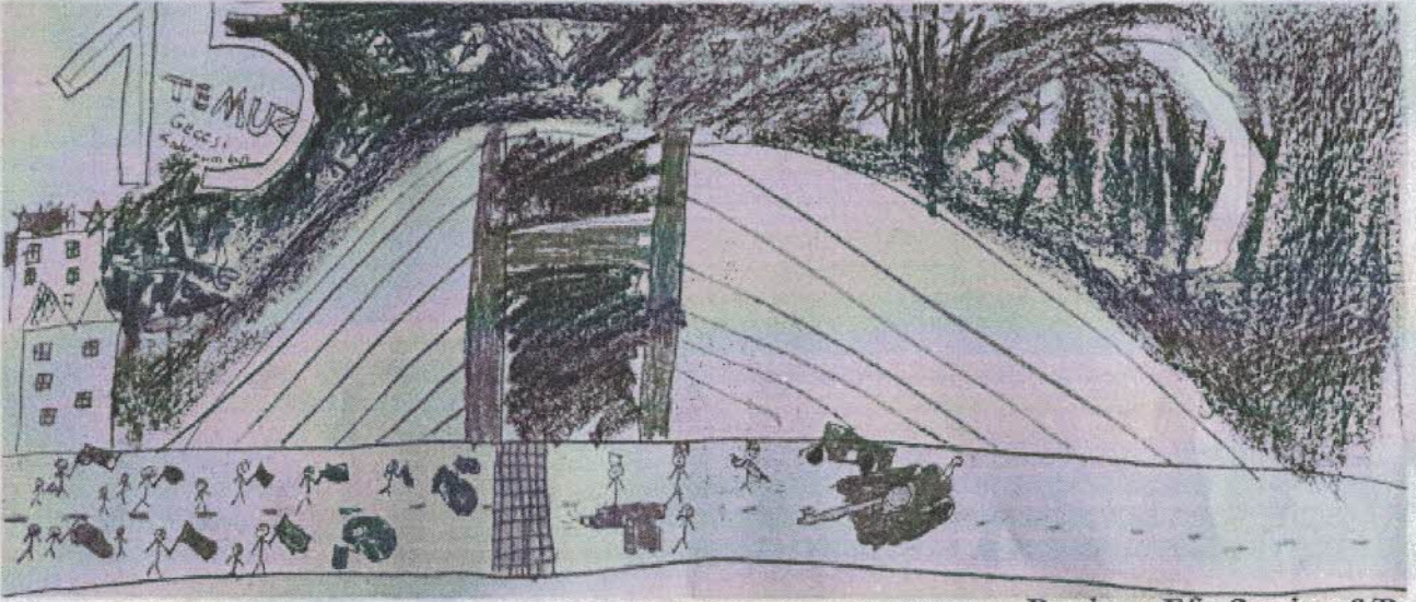
Resim : Efe Seyis - 6/B