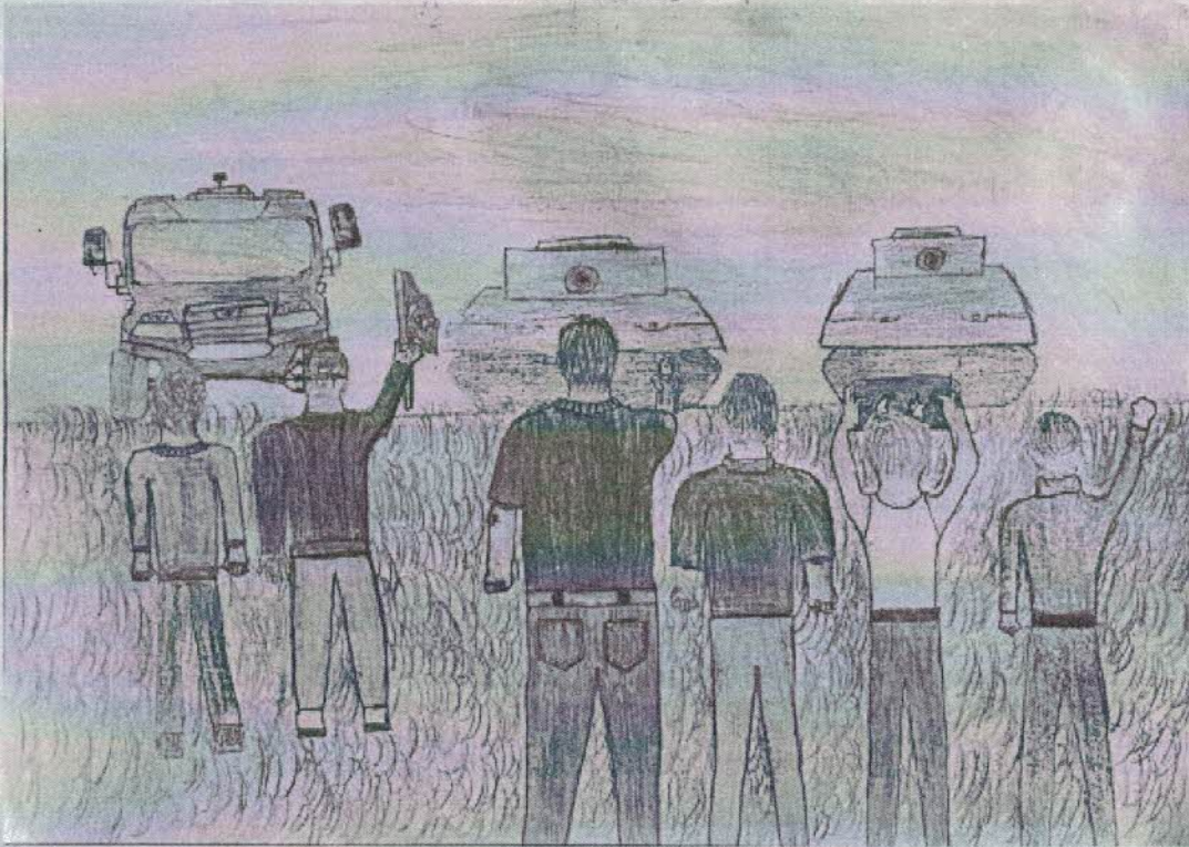
Resim : Fatmanur KOÇAK - 8/A